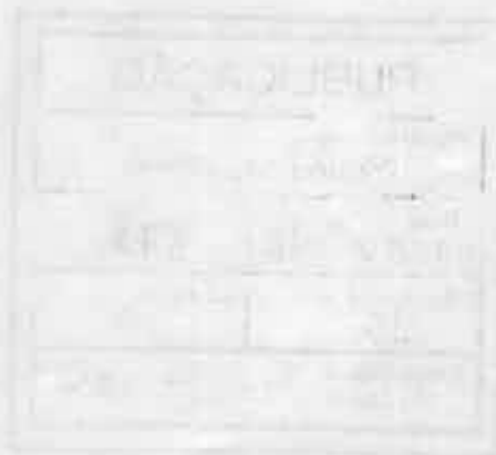
Evaldo Barbosa Prefeito Municipal