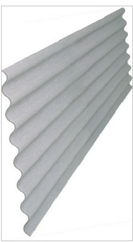
04 Detalhe ESC.: 1/100

A Telha de Fibrocimento Ondulada é versátil e se adapta perfeitamente a todos os tipos de cobertura. Por isso, independente do tipo de construção, sempre proporciona um resultado harmonioso. Além disso, tem uma variada gama de peças complementares o que reduz o custo da obra e aumenta a estanqueidade e a durabilidade do produto. Muito conhecida pelos consumidores, as telhas de fibrocimento são produtos leves, resistentes às variações climáticas e que proporcionam uma boa estética ao ambiente externo.